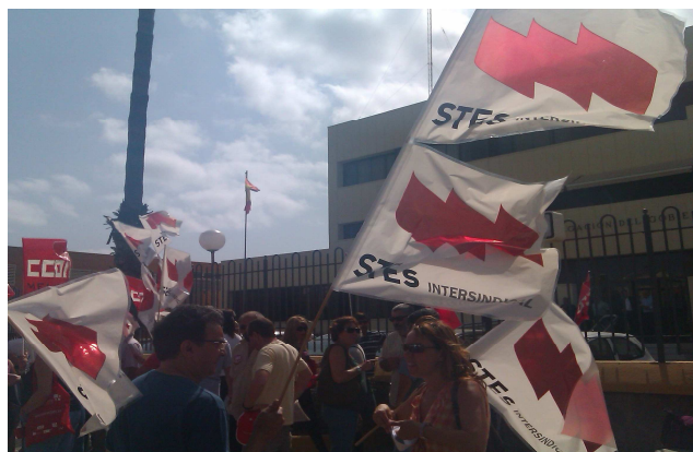
Concentración de representantes sindicales ante la Delegación del Gobierno de Melilla el 20 de septiembre