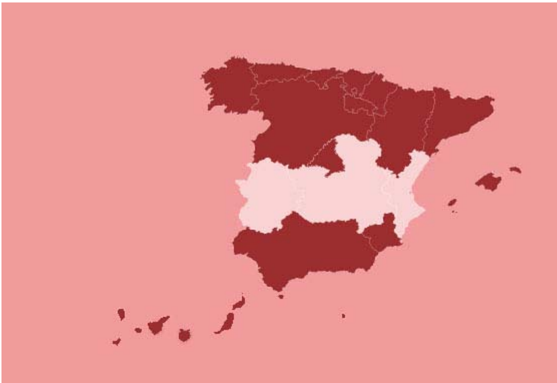
Mapa 2: España y las Comunidades Autónomas en PISA 2009

Comunidades Autónomas que amplían muestra en PISA 2009: